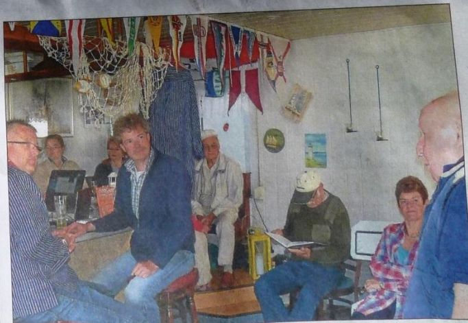
Die Freizeitkapitäne werden in den Verlauf der Eröffnungsfahrt eingewiesen.